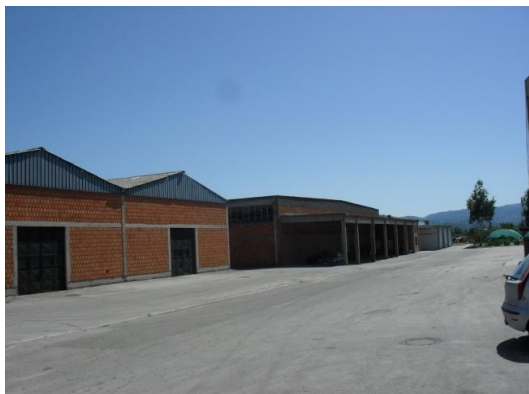
Unutar poslovnog kompleksa u Požegi