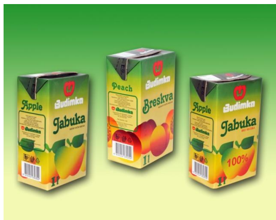
Voćni sokovi 100% i nektari