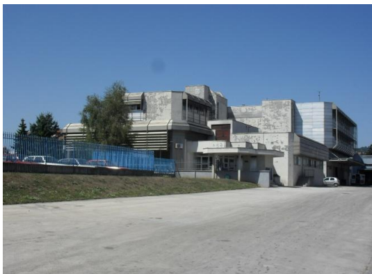
Upravna zgrada u Požegi