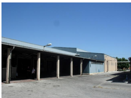
Poslovni kompleks u Požegi

Proizvodi Društva su visokog kvaliteta. Na Sajmu etno hrane i pića 2010. godine, Budimkin kašasti voćni sok „Nektar od breskve“ je dobio priznanje Diploma etno hrana i piće – robna marka iz Srbije.