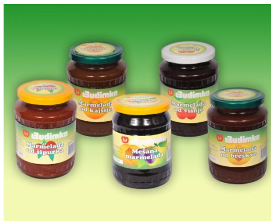
Marmelade od raznih vrsta voća